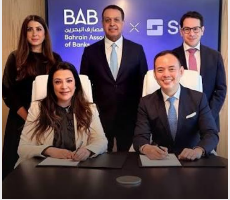
المنامة - المنصة الاقتصادية

وتضمنت المقترحات إطلاق مبادرة "رائدة أعمال الشهر" لتسليط الضوء على قصص النجاح النسائية في قطاع الأعمال وتكريم النماذج الملهمة بشكل دوري، إضافة إلى تنظيم ورش عمل متخصصة وبحث فرص التعاون مع الجهات الحكومية والخاصة والمؤسسات التعليمية.