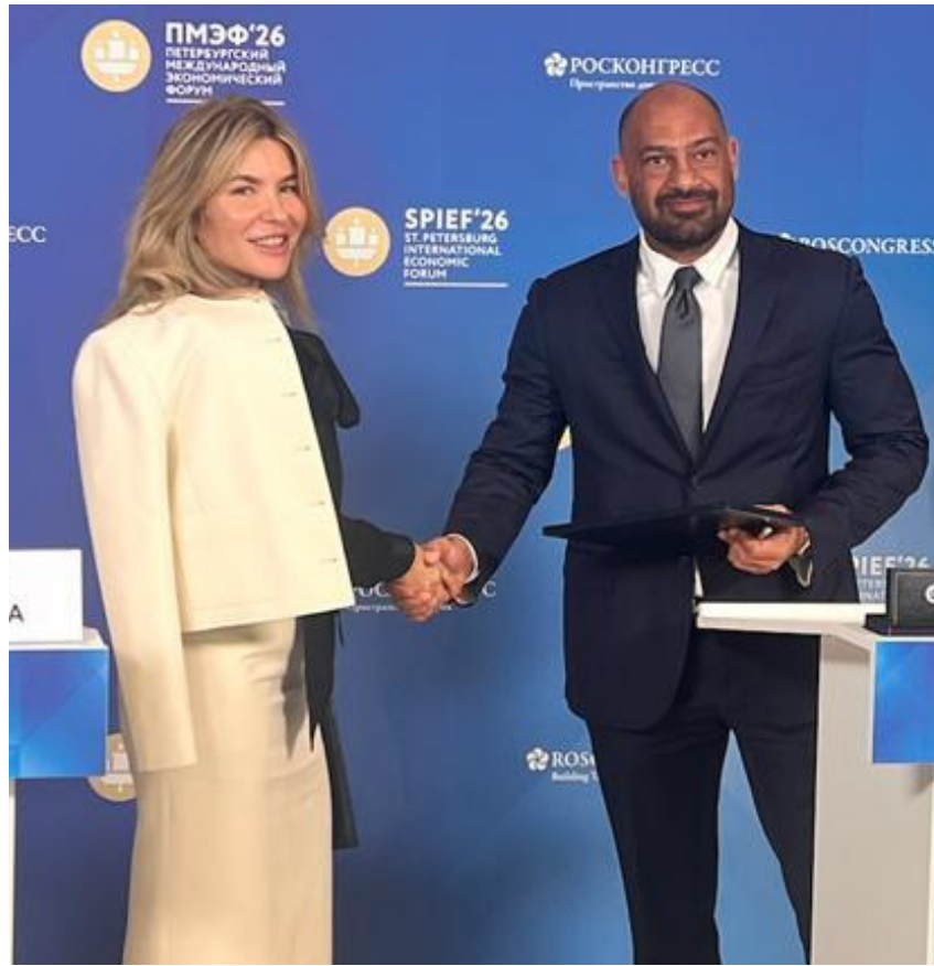
المنامة - المنصة الاقتصادية

ومن المتوقع أن تركز المنصة على تحقيق عوائد معدلة حسب المخاطر من خلال دمج خبرات التطوير والإدارة النشطة للأصول، بما يعزز القيمة طويلة الأمد للمستثمرين. ويذكر أن جي إف إتش يدير حالياً أصولاً وصناديق استثمارية بقيمة تقارب 24 مليار دولار أمريكي، موزعة على محفظة دولية تشمل دول مجلس التعاون الخليجي والولايات المتحدة الأمريكية وأوروبا، وتغطي قطاعات اللوجستيات، والرعاية الصحية، والتعليم، والتكنولوجيا، والعقارات.